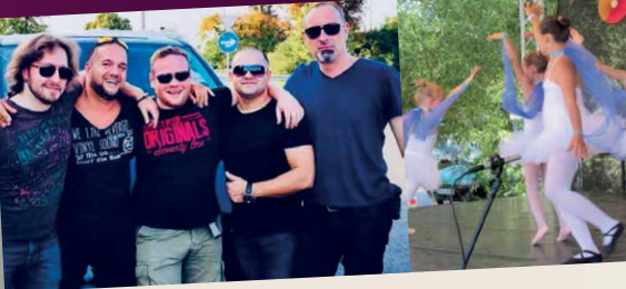
Live Party Band 22:00-24:00