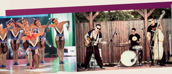
Mystery Gang 20:20-21:00